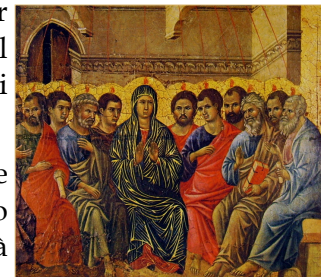
Duccio di Buoninsegna, Maestà, particolare. Siena, Museo dell'opera Metropolitana