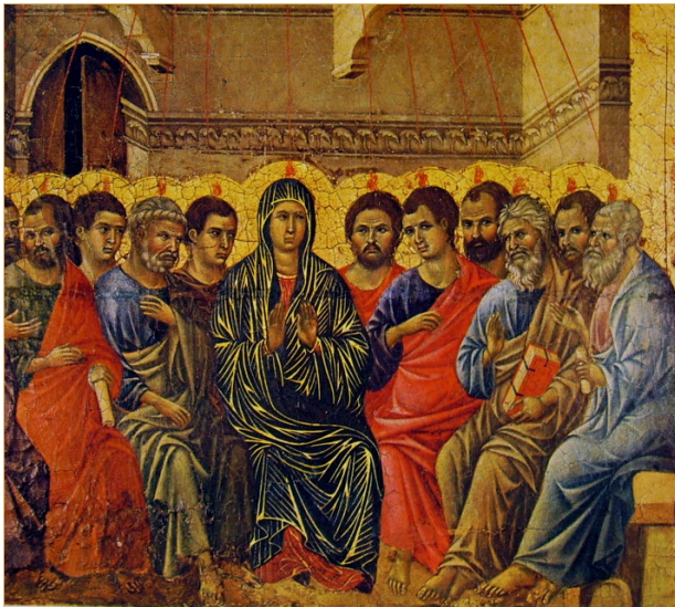
Duccio di Buoninsegna, Maestà , particolare . Siena, Museo dell'opera Metropolitana

Rivelata nella Pentecoste, la Chiesa è chiamata per "correre le strade" che la Parola le indica perché sia glorificata 2Tes 3,1.