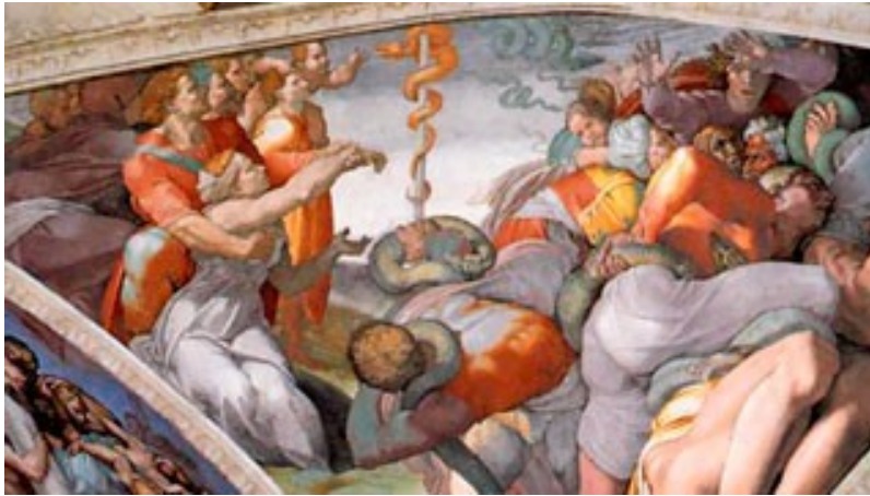
Michelangelo Buonarroti, Il Serpente di bronzo Cappella Sistina, Roma, Musei Vaticani

Il Serpente di bronzo è un affresco di Michelangelo Buonarroti, databile 1511-1512 circa e facente parte della decorazione della volta della Cappella Sistina, nei Musei Vaticani a Roma, commissionata dal papa Giulio II. In questa scena, come nelle altre immediatamente vicine, l'artista si avvale della visione di scorci, idonei a una lettura degli affreschi che doveva avvenire in prevalenza lungo l'asse centrale, dalla porta cerimoniale verso l'altare.