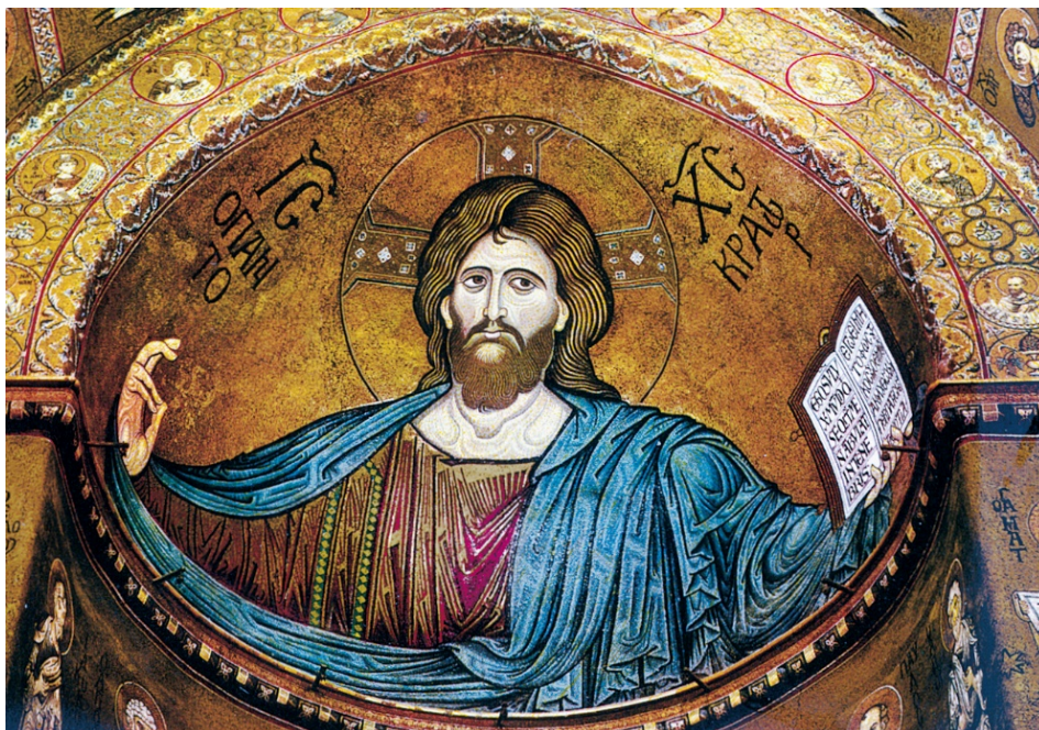
Il mosaico del Cristo Pantocratore nel duomo di Monreale

Qualcuno lo ha definito il tempio più bello del mondo e senz'altro il Duomo di Monreale o Basilica Cattedrale di Santa Maria la Nuova, è uno degli esempi più belli di come l'arte, riesca ad entrare in sintonia con il cuore dell'uomo.