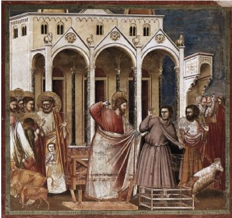
Giotto-cappella degli Scrovegni- Padova

L'affresco della Cacciata dei mercanti dal tempio , databile al 1303-1305 circa, è parte dei dipinti sulla vita di Gesù, realizzati da Giotto nella navata, sulla parete sinistra, 1° riquadro da destra della Cappella Scrovegni a Padova.