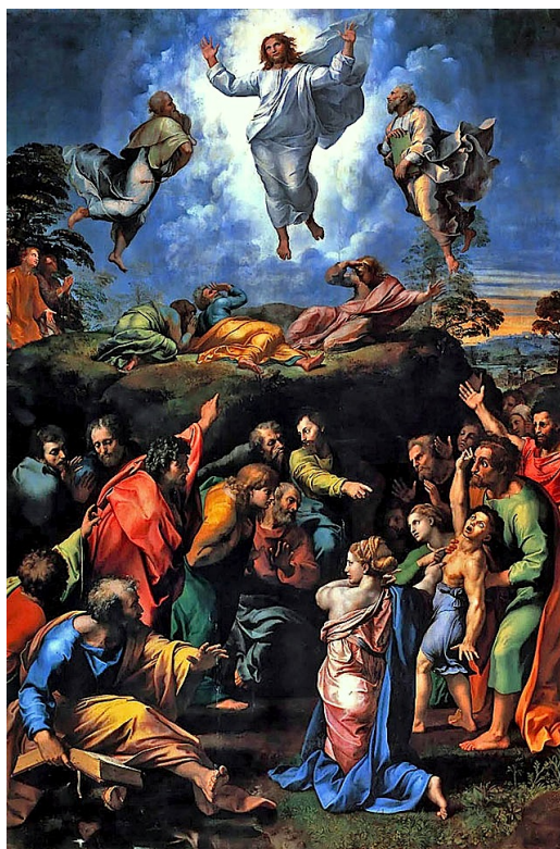
“La trasfigurazione” Raffaello Sanzio Pinacoteca Vaticana, Città del Vaticano.

Per poter rendere partecipe chi guarda dell’episodio narrato nei vangeli, Raffaello utilizza questa visione. Cristo è rappresentato in preghiera estatica, le mani alzate nel gesto antico e forse, alludono anche alla croce annunciata otto giorni prima; Egli si libra in una nube, al centro di un ideale disco tracciato dai corpi di profeti e apostoli, in un cielo trasparente di luce e intenso di colore.