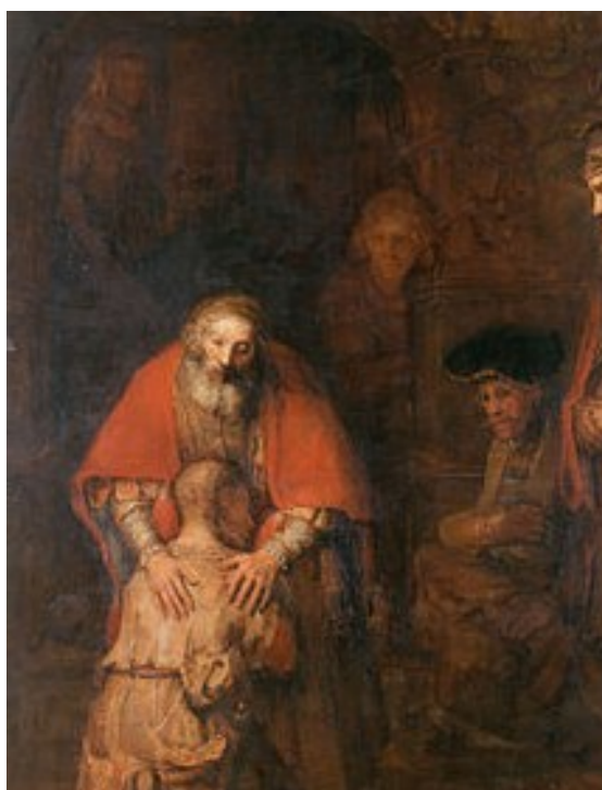
Rembrandt- Il Ritorno del figliol prodigo- Hermitage Museum di San Pietroburgo

Il Ritorno del figliol prodigo è un dipinto a olio su tela (262x206 cm) di Rembrandt, databile al 1668 e conservato nel Museo dell'Hermitage di San Pietroburgo.