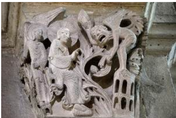
Capitello Cattedrale di St. Lazare, Autun

Dopo il battesimo e prima della vita pubblica, Gesù affronta, un tempo di solitudine ritirandosi nel deserto per digiunare e pregare quaranta giorni e altrettante notti. Questo periodo può essere l'esperienza di qualsiasi persona che, come Gesù, scelga di ricavarci dei tempi per ascoltare sé stesso in solitudine e proprio il distacco, il momentaneo allontanamento dal quotidiano, dall'abitudine, fa