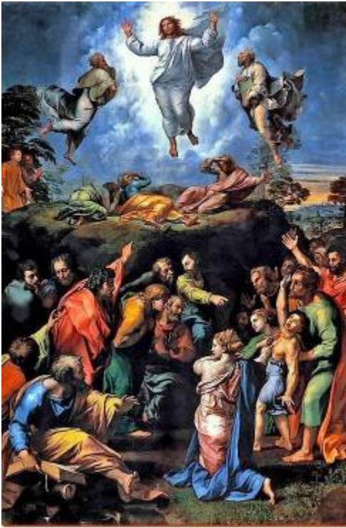
Trasfigurazione di Gesù, Raffaello Sanzio, 1518-1520, Pinacoteca Vaticana, Città del Vaticano.

L'ultima opera di Raffaello Sanzio è la grande pala da altare che raffigura l'episodio della trasfigurazione di Gesù come raccontato nei Vangeli.